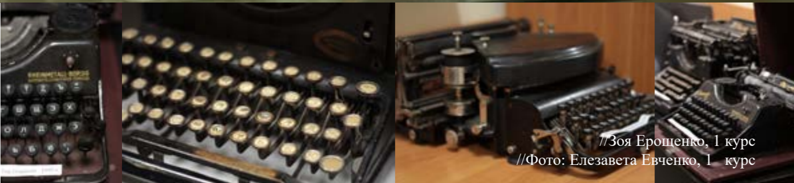
//Зоя Ерощенко, 1 курс //Фото: Елизавета Евченко, 1 курс